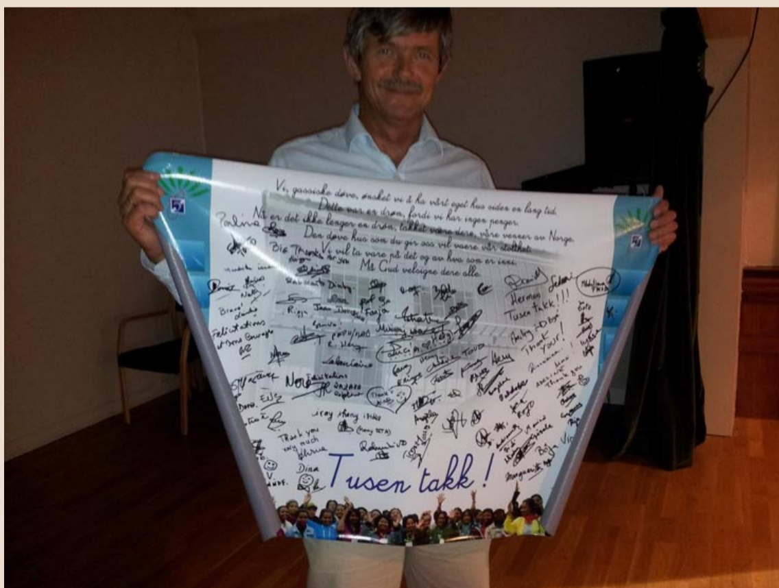
På innvielsesdagen var det mange madagassere som ville takke Norge for gaven (både innsamling til kjøp av Døves Hus, og til kjøp av inventar). De signerte med sitt navn på den store plansjen, som er plassert på Ål folkehøyskole og kurscenter for døve. Der kommer det veldig mange på kurs o.a. så da blir det bli sett av flest mulig :-)