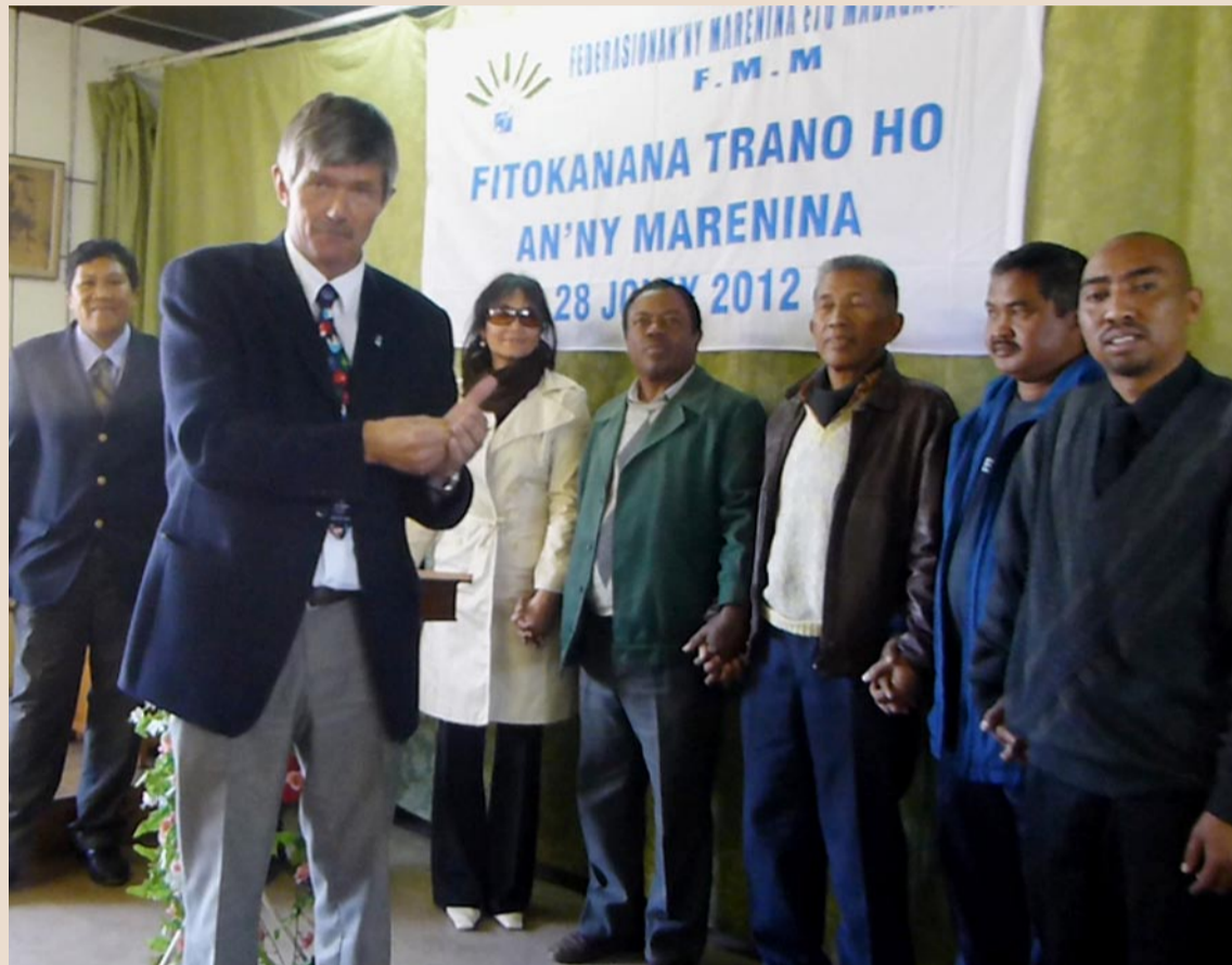
Bildet er fra åpning av Døves Hus på Madagaskar. Damen i hvit kåpe er Befolkningsminister (statsråd) på Madagaskar. Sammen med Rune fikk hun æren av å klippe snoren til Døves Hus lørdag 28. juli 2012 kl. 13.

Konto nummer 1503.30.31960 . Støtte til Madagaskar.