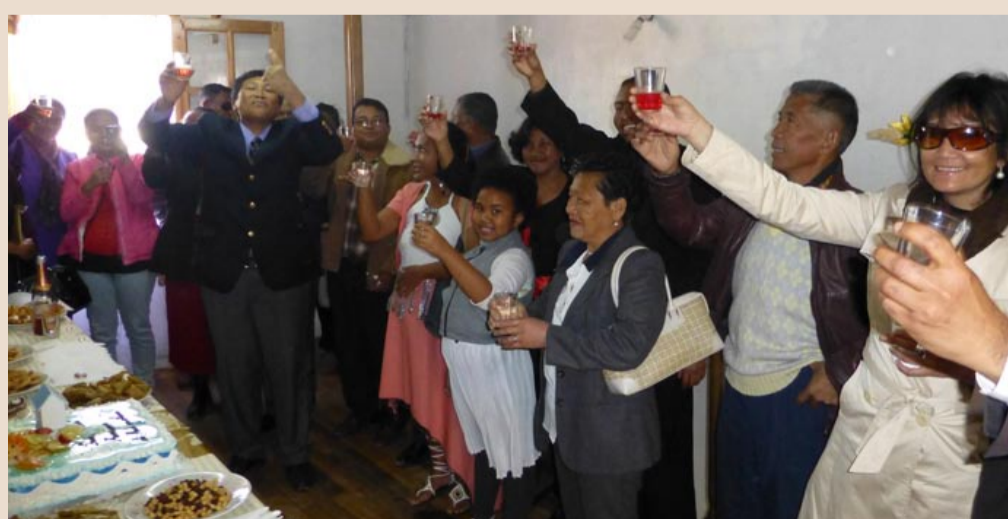
Skåååål ! Nå er Døves Hus innviet, og kan taes i bruk. Det første og eneste Døves Hus på Madagaskar.