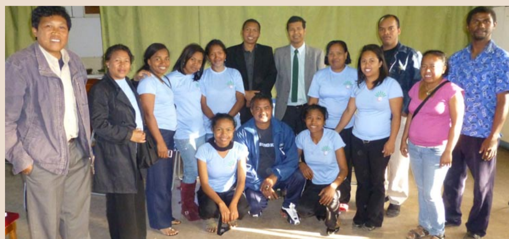
Representanter fra Madagaskar Døveforbund, Antananarivo Døveforening og Antananarivo Døves Kvinneforening hadde møte og diskuterte bruk av Døves Hus.